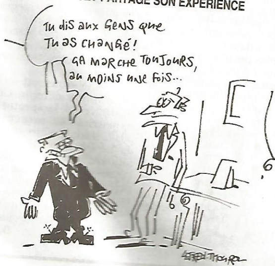
4 - « Le Canard enchaîné » - mercredi 20 avril 2022